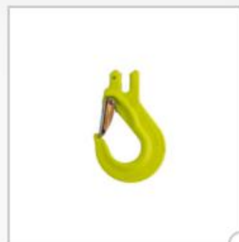
Crochet à chape avec linguet, type EGKN