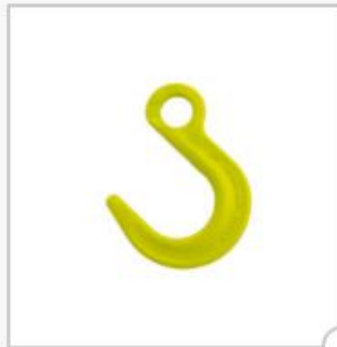
Crochet de fonderie, type OKE