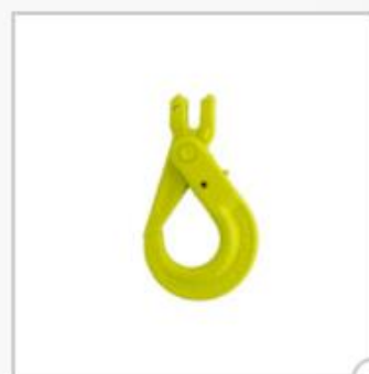
Crochet de sécurité, type BKG