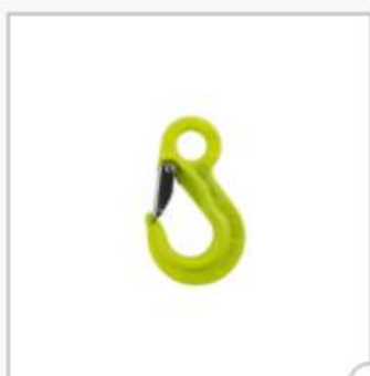
Crochet à elingue avec linguet, type EKN