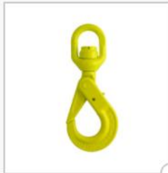
Crochet de sécurité à émerillon à billes, type BKLK