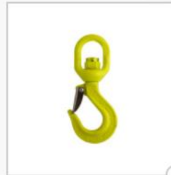
Crochet de charge avec linguet et émerillon, type LKN