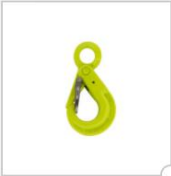
Crochet de sécurité, type BKD