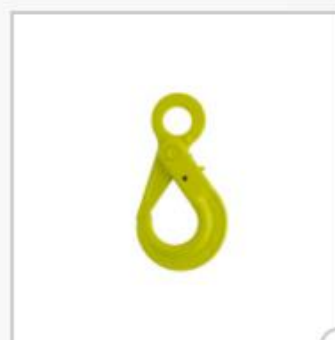
Crochet de sécurité, type BK