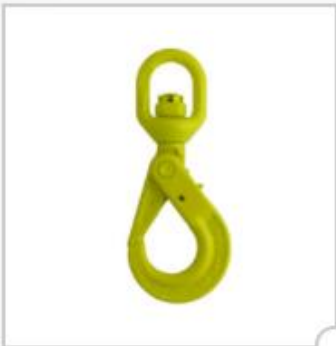
Crochet de sécurité à émerillon, type BKL