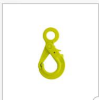
Crochet de sécurité, type OBK