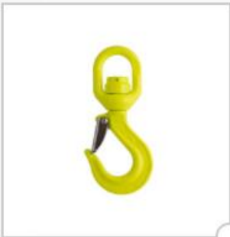
Crochet de charge avec linguet et émerillon, type LKNK