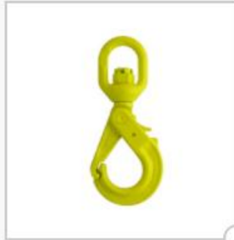
Crochet de sécurité à émerillon, type LBK