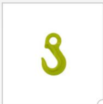
Crochet à elingue sans linguet, type EK