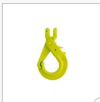
Crochet de sécurité, type GBK