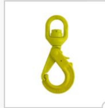
Crochet de sécurité à émerillon à billes, type LKBK