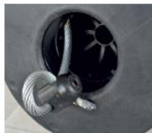
➤ Attache-câble auto serrant accessible et très sûr.