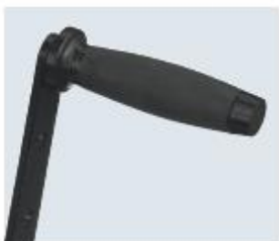
➤ Poignée de manivelle ergonomique bi-matériau "soft touch".