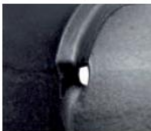
➤ Guidage de bon enroulement du câble.