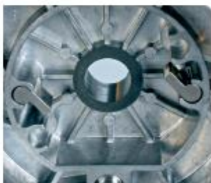
➤ Sécurité maximale : 2 cliquets.