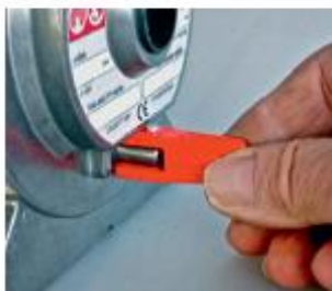
➤ Débrayage impossible en charge.